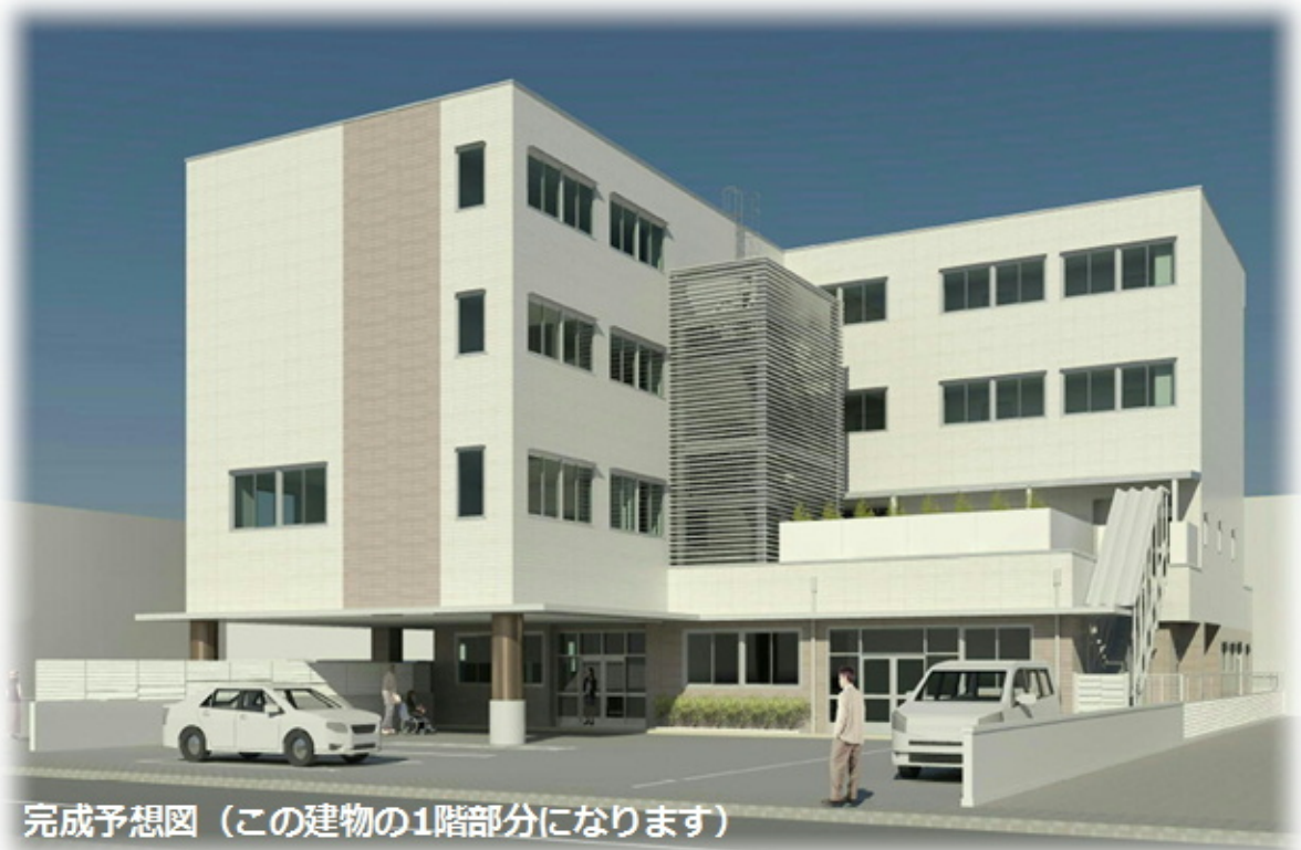
完成予想図（この建物の1階部分になります）